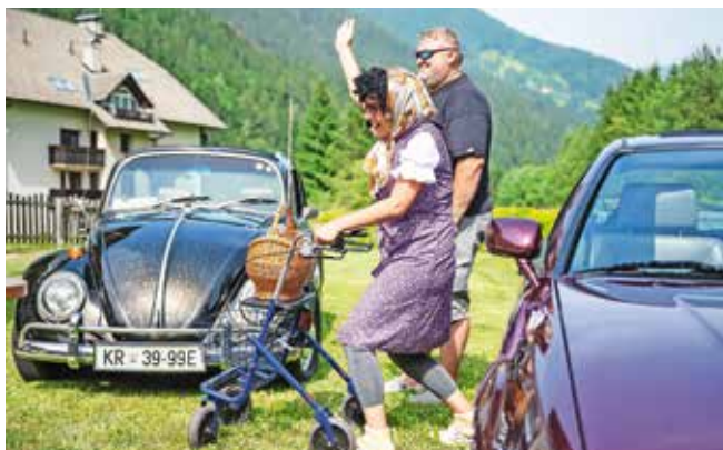
Zofka je poskrbela za smeh.