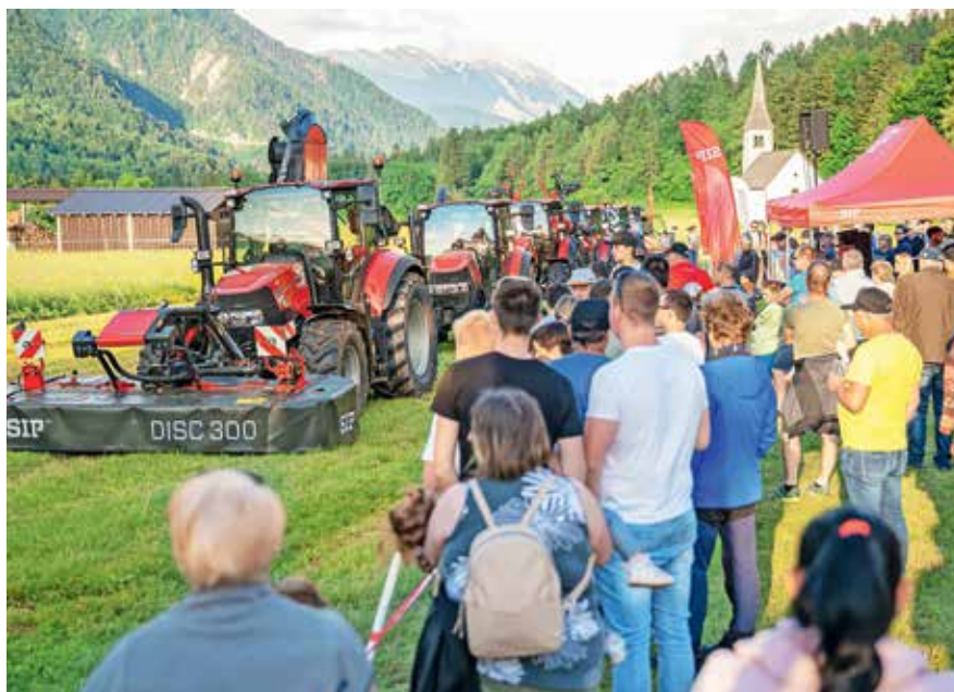
Prikaz kmetijske mehanizacije

Društvo, ki je bilo ustanovljeno z namenom, da povezuje mlade s podeželja ter tiste, ki čutijo povezanost z njim, trenutno šteje 66 članov, starih od 15 do 40 let, iz občin Kranjska Gora, Jesenice, Žirovnica in Gorje.