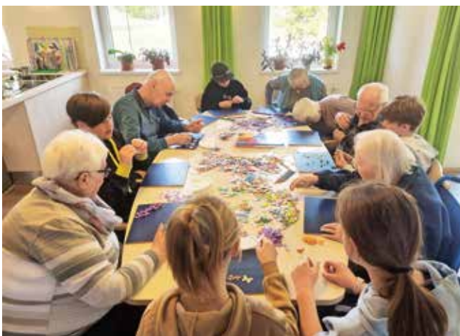
Letošnja tema je bila pomlad