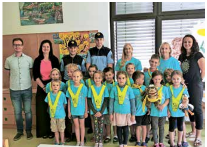
... in OŠ Josipa Vandota Kranjska Gora