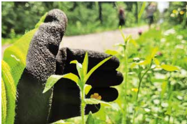
Akcija čiščenja ob kolesarski stezi na Belci

V občini Kranjska Gora so se akcije, kjer so odstranjevali invazivne tujerodne rastline ob kolesarski poti na območju Belce, udeležili štirje prostovoljci, koordinator in županja. Akciji so se pridružile Eko Rutaršce, ki so se lotile tujerodnih rastlin tudi v Rutah (več o tem pa v naslednjem Zgornjesavcu).