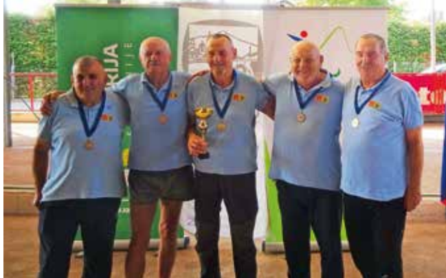
Kranjskogorska ekipa z odličnim drugim mestom