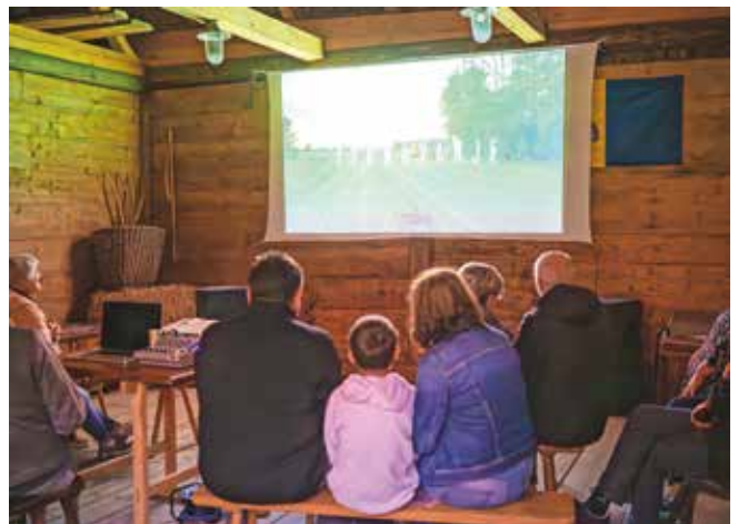
Junija je bil na ogled film Tekmüvanje (zaradi slabega vremena v skednju Liznjekove domačije)