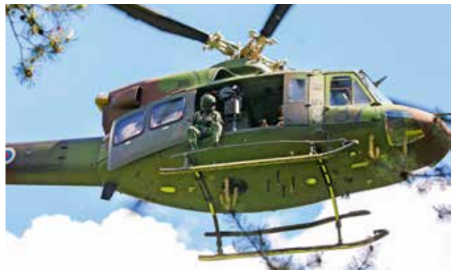
Prikaz reševanja je potekal v ferati Havadnik.

Na prvi petek in soboto v juniju so v kongresnem centru hotela Špik v Gozdu - Martuljku potekali 24. Ažmanovi dnevi, simpozij urgentne, gorske in družinske medicine, ki je potekal pod organizacijskim vodstvom Osnovnega zdravstva Gorenjske – OE Zdravstveni dom Tržič in Gorske reševalne zveze Slovenije (GRZS). Udeležili so se ga predvsem urgentni in družinski zdravniki ter člani njihovih timov (sestre, zdravstveniki, reševalci), zdravniki in drugi medicinci GRZS ter Helikopterske nujne medicinske pomoči (HNMP), ki so imeli na voljo številna predavanja o aktualnih zdravstvenih temah ter tudi temah, ki so na drugih strokovnih srečanjih pogosto v manjšini. Simpozij je bil namenjen tudi počastitvi dvajsetih let HNMP Slovenije. V ferati Havadnik so demonstrirali helikoptersko reševanje, v katerem sta sodelovala vojaški in policijski helikopter, prikazali pa so oskrbo osebe v anafilaktičnem šoku in osebe po padcu v steni. N. T.