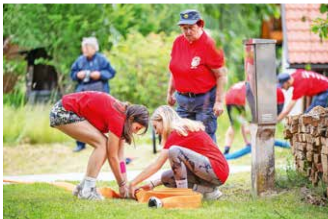
Gasilska mladina je izvedla tridelni napad v dveh smereh.