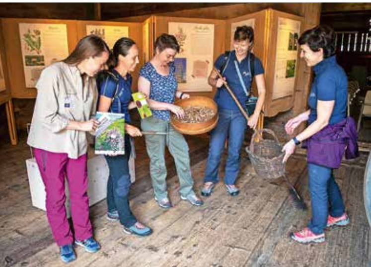
Sodelavke nedavnega dneva odprtih vrat ob razstavi Vse arcnije iz rož narejene