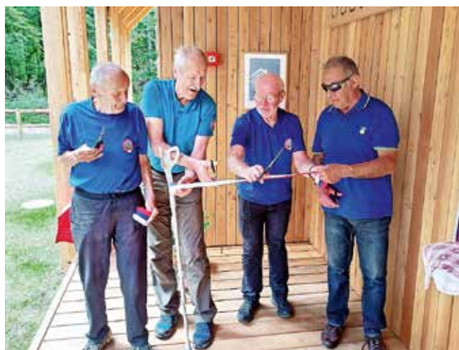
Slavnostni trak so prerezali častni člani PD Dovje - Mojstrana.