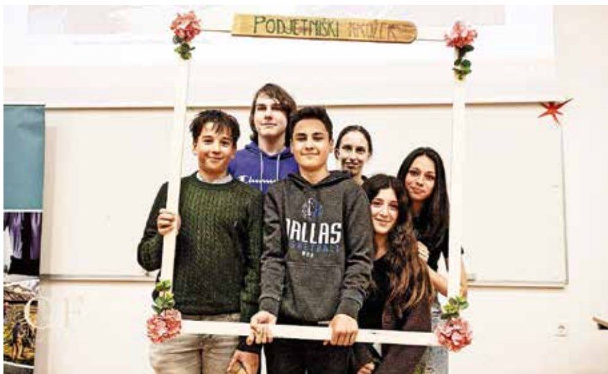
Kranjskogorski učenci so podjetje poimenovali 3D Gorenci.

hrano in pijačo. Predvideli smo dobiček 200 evrov.«