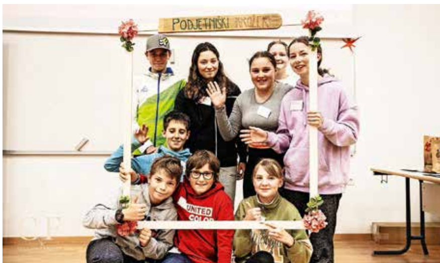
Mojstranški učenci so podjetje poimenovali Pop Corn Kino Mojstrana.