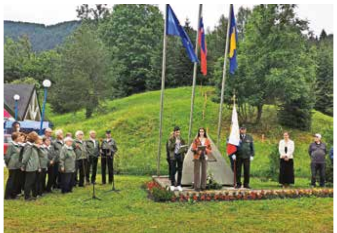
Sodelujoči v programu na spominski slovesnosti