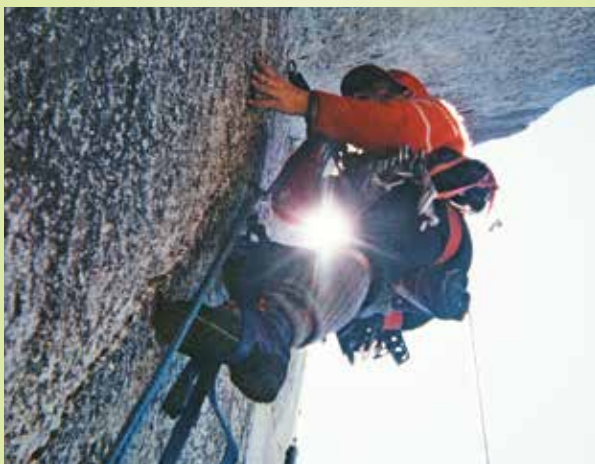
Pleza Miha Smolej

Si želite na Triglav, pa tega ne zmorete ali nimate prave opreme? Nič ne de, za vas imamo pripravljen virtualni vzpon na najvišjo slovensko goro in virtualni spust po jeklenici. Pristali boste prav pred našim muzejem.