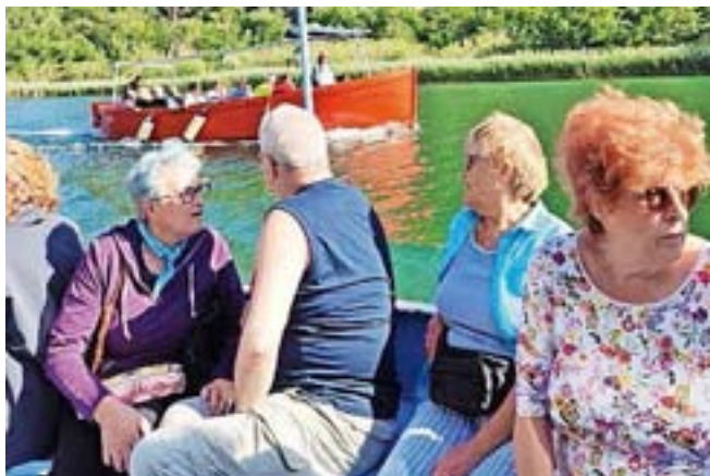
S čolnom po reki Cetini