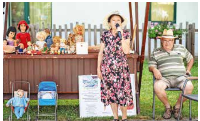
Na ogled so bile tudi stare igrače.