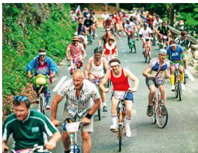
Na Vršič že devetič