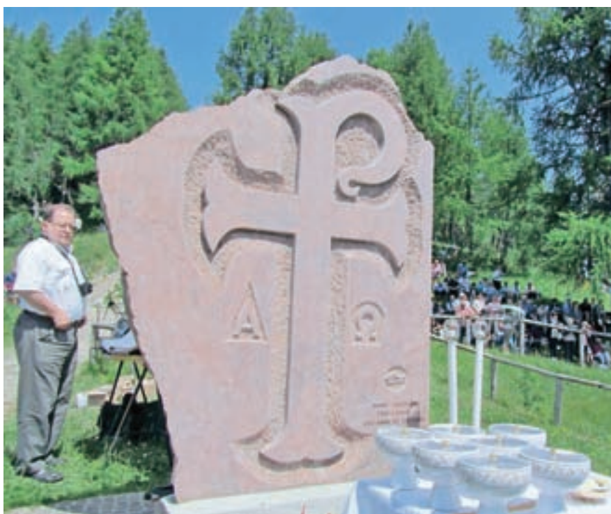
Kamnito znamenje spominja na dogodek pred 660 leti, ko je žabniški pastirček našel Marijin kip in so Višarje postale romarska pot.

Na skoraj 1800 metrov visoki višarski gori, Monte Lussari po italijansko, pod katero se stikajo tri doline, Zgornjesavska v Sloveniji, Ziljska na Koroškem in Kanalska v Italiji, in od koder se odpira pogled na romanski svet na zahodu, germanskega na severu in slovanskega na vzhodu in kjer se srečujejo štirje jeziki, italijanski, furlanski, slovenski in nemški, so že pred stoletji postavili prvo kapelico. In to na mestu, kjer je leta 1360, to je pred 660 leti, žabniški pastir našel kip Marije z Jezusom. Kapelico so dograjevali