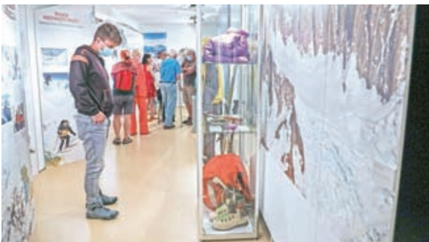
Če doma hranite dragocenosti kateregakoli vzpona, jih lahko prinesete v muzej. S tem bo planinski hram še bogatejši.