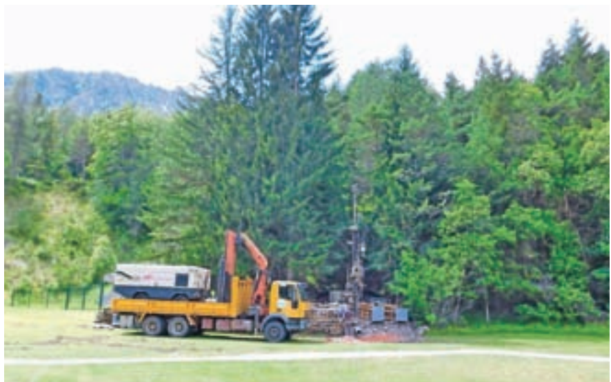
Vrtina pri Best Western hotelu v Kranjski Gori