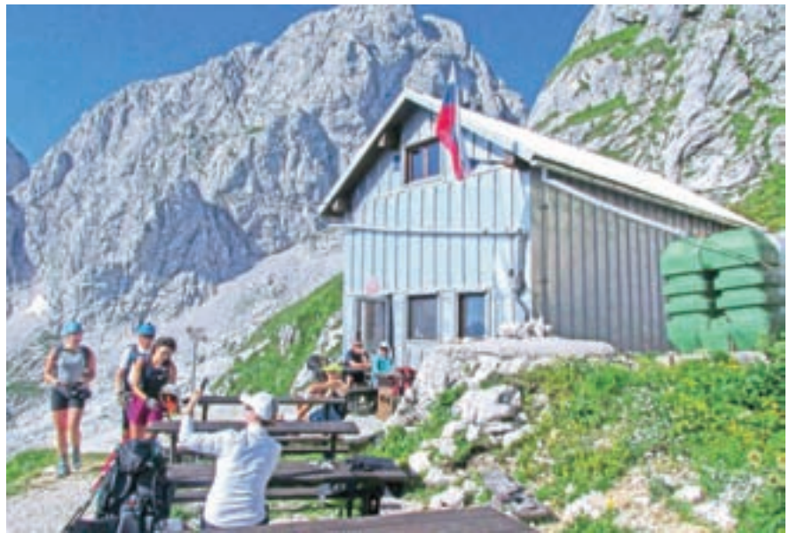
Zavetišče pod Špičkom v Triglavskem pogorju, ki je z 2064 metri najvišja točka za žige v akciji Jeseniški cirkel.

Gorski svet v okolici Kranjske Gore in širše v Zgornjesavski dolini je prepleten s planinskimi potmi. Vodijo mimo koč na vrhove, ob njih so številne naravne in kulturne znamenitosti. Da bi ponudile še več doživetij, različni organizatorji skrbijo za pohodniške akcije, v okviru katerih planinci zbirajo žige koč, se vpisujejo v knjižice, za povrh pa dobijo še kakšno nagrado. Že lepo število let je znana akcija Pravljična pot deset koč. Na širšem območju Kranjske Gore vsak lahko obiše deset koč in se obenem odloči lahko še za vzpone na okoliške vrhove, na razglednih točkah občuduje gorski svet in znamenitosti. Za to akcijo je na voljo zbiranka v TIC-u v Kranjski Gori in v posameznih kočah. Vsakdo lahko obiše te kočice in