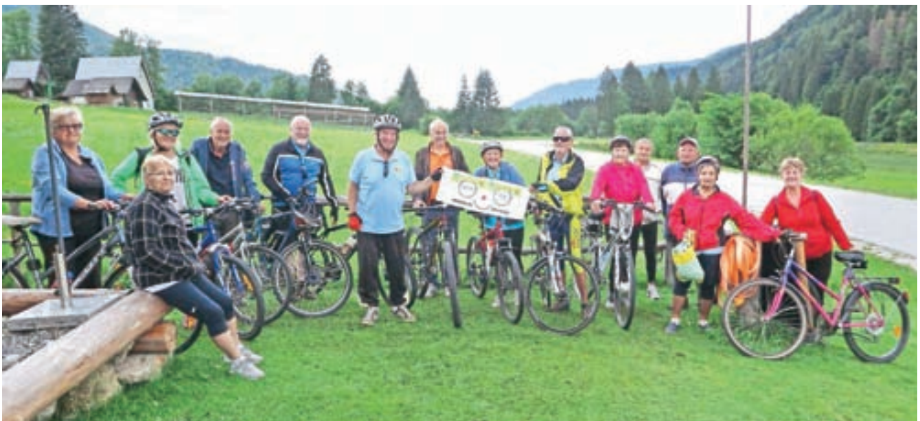
Kolesarili so dan pred občinskim praznikom, 6. avgusta.