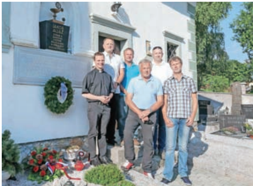
Položili so venec na grob Jakoba Aljaža na pokopališču na Dovjem.