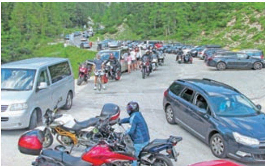
Poglavje zase je pretok prometa in parkiranje.

Vršič s 1611 metrov nadmorske višine kot najvišji slovenski gorski prelaz v avgustovskih dneh doživlja vrhunec planinske in izletniške sezone. Enostavno je težko najti odgovor na vprašanje, od kod takšna priljubljenost za obisk in doživetja v tem delu gorskega sveta. Gre za najpomembnejšo turistično cesto v Sloveniji, ki povezuje Posočje s širšo Slovenijo. Kljub ne najboljšim obetom pred sezono zaradi situacije s koronavirusom je avgust glede na množice obiskovalcev takšen, kot da sploh ne bi obstajal. Že v jutranjih urah se tam ustavijo planinci, ki se odpravljajo po lažjih poteh, priljubljen je izlet na Sleme. Bolj izkušeni osvajajo zahtevnejše vrhove (Prisojnik, Jalovec). Ustavljajo se izletniki in drugi popotniki, ki občudujejo naravo, se odpravijo na krajše izlete ali zgolj uživajo v pogledih na vršace. V okoliških planinskih kočah imajo sicer predvsem ob koncih tedna polne roke dela, sama sezona glede prometa pa verjetno ne bo dosegla odličnih prejšnjih sezon. V Tičarjevem domu