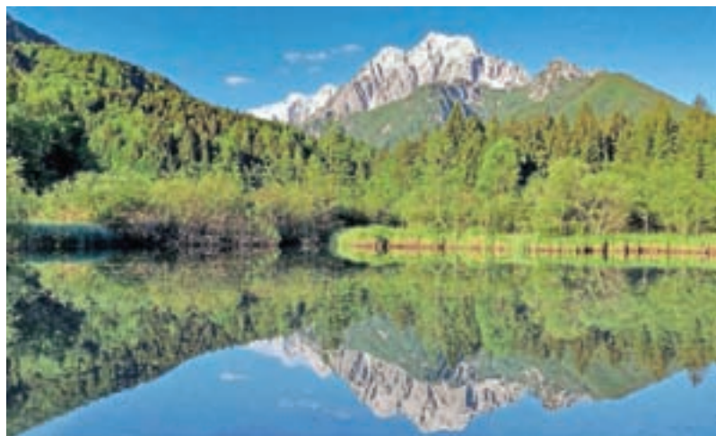
Jalovec