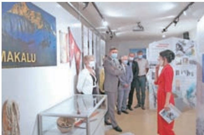
Slovenski planinski muzej s svojo bogato zbirko ter zanimivimi in izvirnimi razstavami že deset let privablja ljubitelje palninstva, gornišstva in alpinizma.

zija," je poudaril Hrovat, ki je prepričan, da bo muzej tako uspešen še nadaljnjih ne le deset, ampak sto let in več. "Zahvaljujem se vsem idealistom, ki so udeležili svoje sanje o slovenskem planinskem muzeju. K sreči je tudi tedanja oblast in politika s planinsko javnostjo prepoznala pomen in dala podporo izgradnji tega čudovitega objekta, ki je lahko v ponos vsem Slovincem," je dejal župan in poudaril, da upa, da bo v prihodnje po vzoru poslovno uspešnih tovrstnih projektov doma in v tujini tudi muzej v Mojstrani "stopil na svoje noge in se osamosvojil".