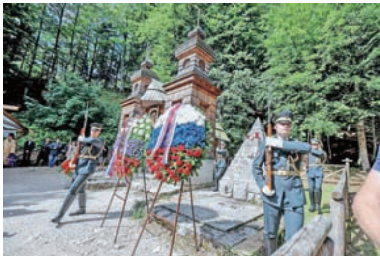
Venca v spomin na umrle ruske ujetnike