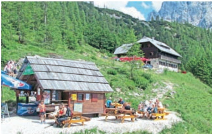
Delo povsod prilagajajo veljavnim ukrepom in priporočilom NIJZ.

veljavnim ukrepom in priporočilom NIJZ. V obeh prodajalnah spominkov na vrhu prelaza postrežejo z informacijami, da je največje zanimanje za nakup magnetkov, nekaj manj za razglednice, vse pa z motivi Vršiča. Poglavje zase je pretok prometa in parkiranje, s čimer Vršič izgublja blišč lepe in nedotaknjene narave. Težko si je predstavljati, kakšno je onesnaževanje ob tolikšnem spuščanju plinov. Včasih se valijo kolone osebnih vozil, kombijev, motoristov, pa še nekaj avtobusov za povrh. Kako vse to v tem vrvežu doživljajo kolesarji in pešci, ni treba posebej poudarjati. Parkirnih prostorov je za okoli petdeset avtomobilov, preostali pustijo vozila ob cesti na obeh straneh prelaza tudi po več sto metrov. Prizadevanja za ureditev pretoka prometa in umirjanja stanja obstajajo, država (preko prelaza vodi državna cesta), sosednji občini Kranjska Gora in Bovec ter TNP bodo morali bolj odločno strniti sile in marsikaj lepo napisanega uresničiti v praksi. Dobro študijo za izboljšanje stanja, tudi z izgradnjo predora, je že leta 2009 pripravila nevladna organizacija za zaščito Alp CIPRA.