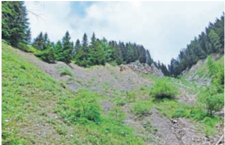
Plaz pod Vošco

Do približno konca novembra bo zaradi sanacije in obnove javne infrastrukture popolna zapora ceste na odseku Naselje Slavka Černeta, ki bo premikajoča v dolžini približno dvajset metrov. V primeru nujne intervencije mora izvajalec del omogočiti prevoznost na zaprtem območju. S. K.